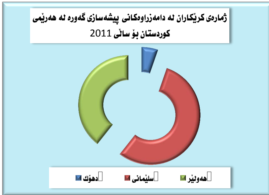
وینە‌ی ژماره (3)